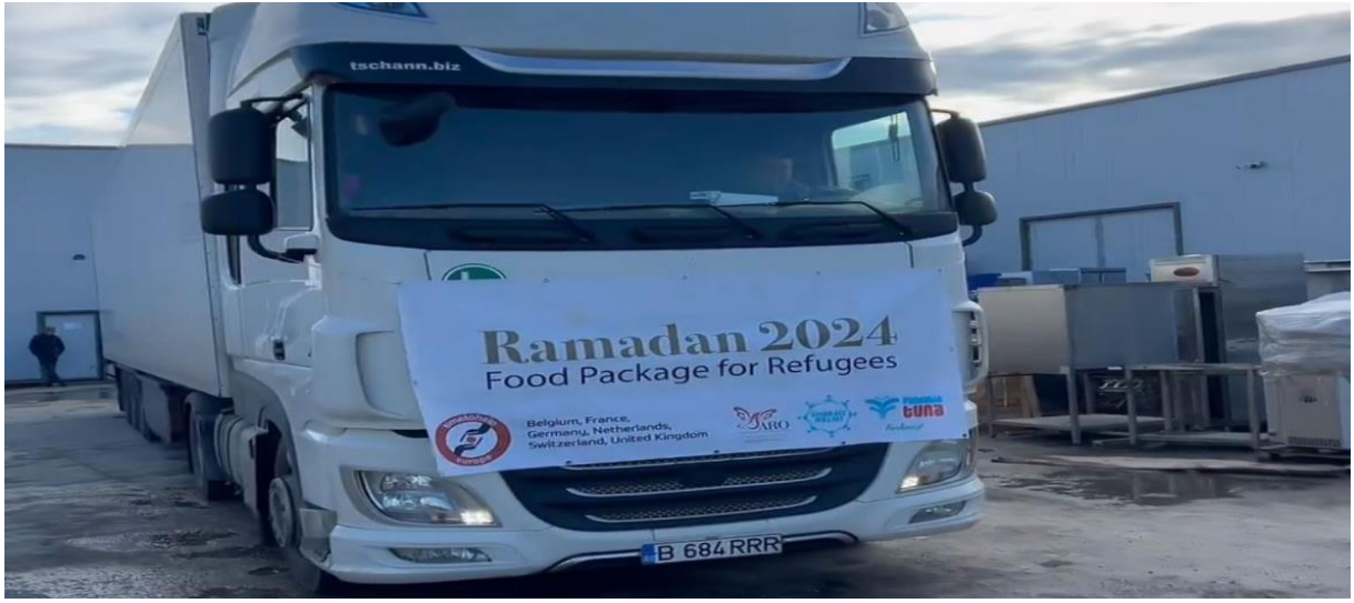
Tablo – 1 (Kuruluşların ortak olarak düzenledikleri sözde mülteci yardımı)

Açık kaynak araştırmalarında, Avrupa ülkeleri ve ABD’de insani yardım kuruluşu kisvesi altında faaliyet gösteren FETÖ/PDY terör örgütü iltisaklı kuruluşların düzenledikleri benzer sözde yardım kampanyalarıyla bağış/yardım ve üyelik aidatları topladığı görülmektedir. Kuruluşların düzenledikleri bu sözde yardım kampanyalarını genel olarak ‘Yunanistan’daki mülteciler, Afrika ülkeleri için temiz su-yemek yardımı, Afrika ülkelerinde yaşayanlar için katarakt ameliyatı, Ramazan ve Kurban bayramlarında fitre, zekat ve kurban bedellerinin toplanması ve eğitim projeleri adı altında olmak üzere 5 kategoride topladıkları görülmüştür. Ayrıca ilgili kuruluşların sözde yardım yaptıkları bölgelerde beraber organizasyonlar düzenlediği örneklerine de rastlanılmıştır.