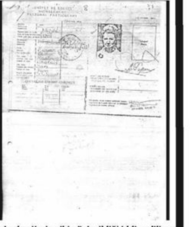
Afroditi Papadopulos'un HÜviyet Cüzdanı. Halkal'da öldürülüp, sahte pasaportla Yunanistan'a gitmiş gibi gösterildiği iddia ediliyor.

oturmışlardır" diye yazmıştı. Dün Taraf'a konuyla ilgili dosyayı getiren varis yakınları, bu cinayetle ilgili de bizlerle bazı bilgi ve belge paylaşmış, MİT raporunda yer alan bir paragrafta dikkat çektiler. MİT raporunda Afrodit Papadopulos'la ilgili şu bilgilere yer verilmişti: "Eşi Yorgi PAPANOPULOS' tan önce öldüğü iddia edilmekle birlikte nerede ve ne zaman öldüğü belli değildir. Büyük bir olasılıkla yaşamaktadır